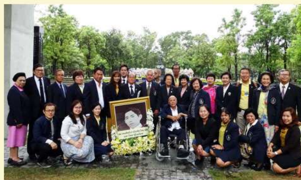
วันมหิดล 24 กันยายน 2561